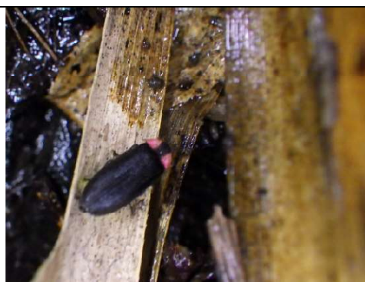
7月21日、ハイケボタル♂、西の谷戸③、19時48分、今期最後に確認したハイケボタルの個体！