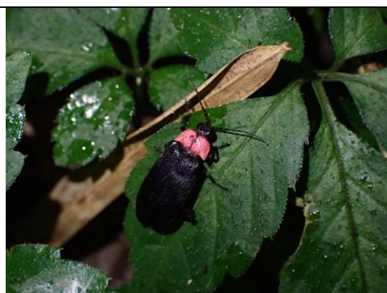
7月11日、ゲンジボタル♀、西の谷戸②奥部、19時54分、今期最後に確認したゲンジボタルの個体！

今期もホタル発生数調査に協力していただいた方、並びに暖かく見守っていただいた(?)皆様に御礼申し上げます。