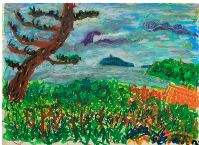
「逗子の海から何か出てきそうな日」 絵 後藤敦史

近所の皆さんにも身近な公園としての親しみと、ランドマークとしての自信と、自分の場所としての誇りを持ってもらえるように育てて行けたらと思う。そこには何でもあるのだから。