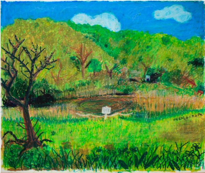
「池子の森の沼から何か出てきそうな日」 絵 後藤敦史

三年ほど前に、妻と二人で蘆花美利維倶楽部（ろかびりいくらぶ）という団体を立ち上げた。往年のロカビリーの愛好団体では無く、桜山八丁目にある蘆花公園の清掃ボランティア団体だ。大掛かりな活動よりも日々の行動