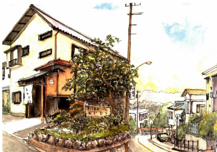
「葉桜団地のある街角」 絵 吉澤 富雄

「今日は富士山がはっきり見えるよ。」「さっきの夕焼けはきれいだったよ。」ご近所での挨拶である。