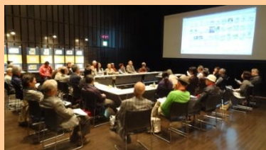
一昨年の瓦版座談会の様子