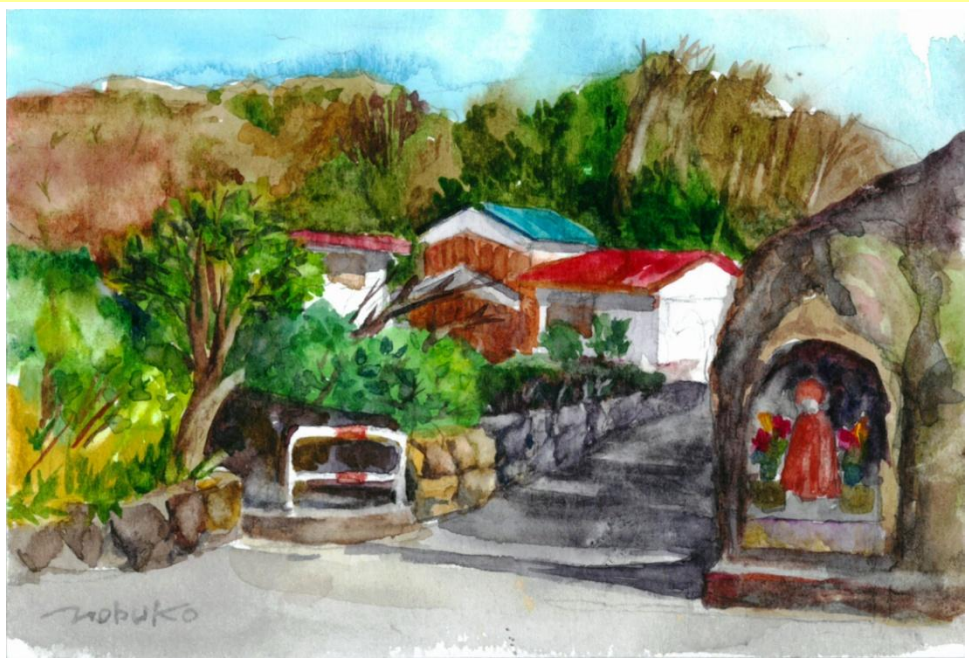
「神武寺駅前の地蔵と水路」