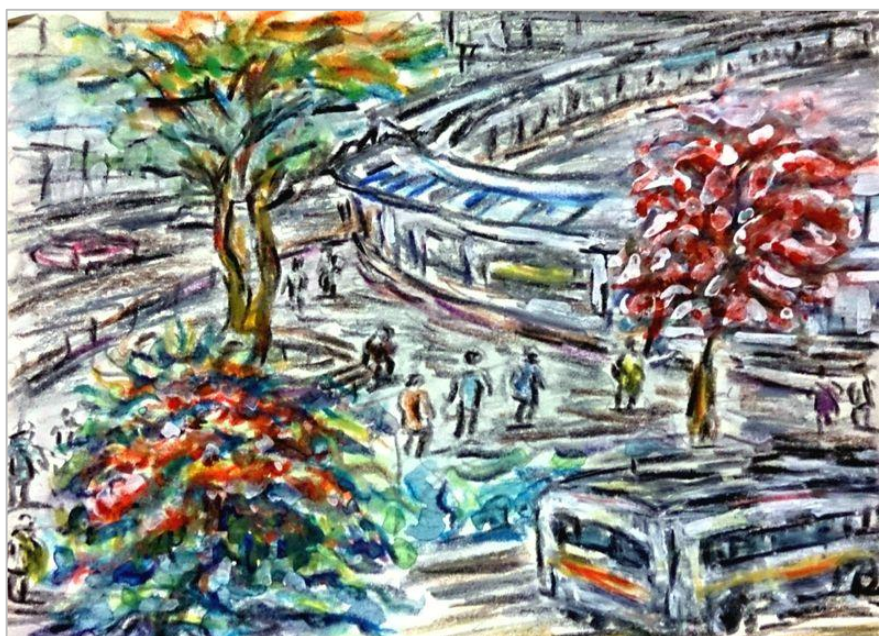
絵 木下 俊延

逗子駅の改札を通り抜け、電車に乗ろうと猛ダッシュで迫ってくる老若男女を何とかかわして駅前のコンビニに立ち寄るのが朝の日課である。師走を迎えそれなりに慌ただしい朝の風景ではあるが、時折海の白いを感じると思わず心が和んでしまう。