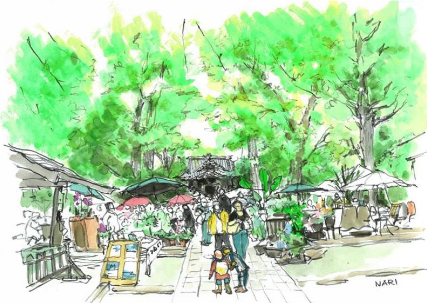
「春のコミュニティーパーク」 絵 永橋 為成

JR逗子駅と京急新逗子駅の間にあり、市役所はすぐ隣、市の中心といえる場所。そんなところに、幹周3メートルを超えるイチヨウ、ケヤキ、クロマツなどの巨木が多数ある緑豊かな一角がある。亀岡八幡宮である。