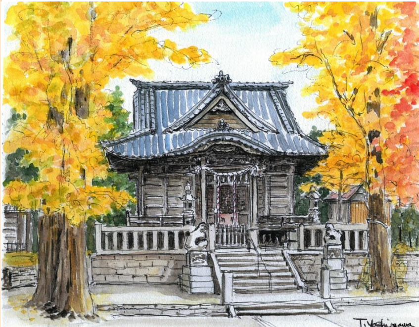
「四季折々の祭事・催し・市民の憩いの場」

オアシスのごとく、亀岡の境内には自然と人が集ってくる。「亀」だけにまた、そのゆるりとした時間の流れから「竜宮城」と言った方がいいかもしれない。私も竜宮城のリピーターの一人である。通勤の行き帰り、朝は日常から仕事モードの非日常に切り替える、夕は仕事のストレスを家庭に持ち込まないため、ベンチに座ってぼーっとする。その緑豊かな景観はもちろん、人それぞれの係わり方を許す実に懐の深い場所。亀岡八幡宮は、逗子の重要な財産ではなからうか。