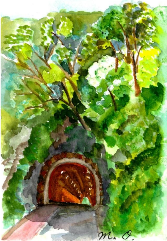
「山の根のトンネル」

四十三年前、父が身延の久遠寺へお詣りに行った帰りに買ってきてくれた。ほんの一米程の苗木が土手の斜面があったのか、みるみる大きく育ち、今は四本の大木になっている。