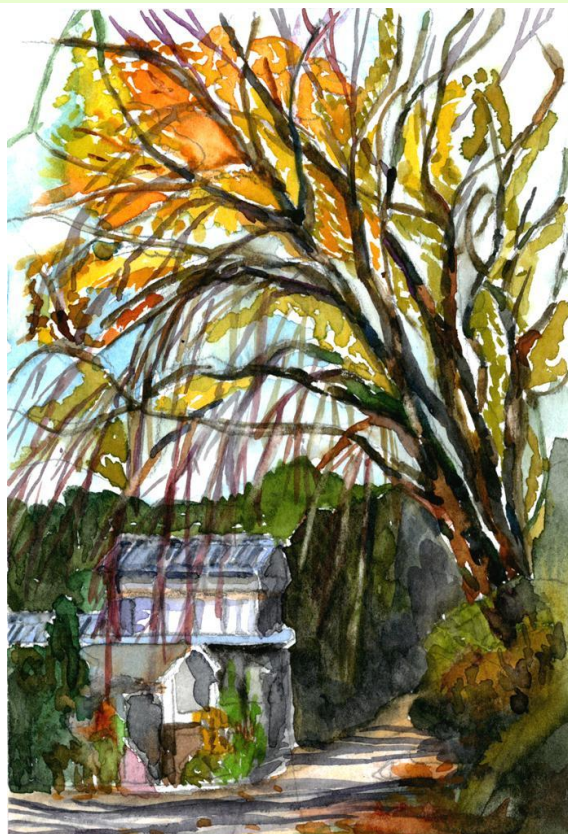
「小山家樹齢四十三年 枝垂れ桜」