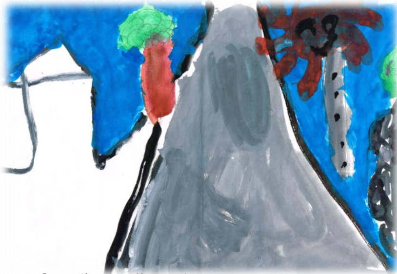
「お日様が出る静かな道」

また細道はくねくねいりくんでいますので、地元の人しか通りません。すれ違う人との距離も近く、自然と挨拶が交わされます。娘たちと散歩しているとよく声をかけられます。挨拶からちょっとした会話が始まったりもまた楽しみの1つです。普段では、挨拶など考えもしませんが、この細道ではごく自然に挨拶ができます。