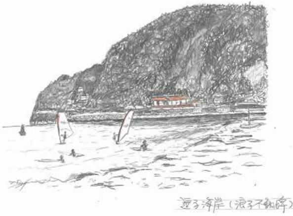
「逗子海岸（浪子不動周辺）」 絵 土谷 正巳

それは海の家が営業が終わる日曜日。夕暮れ時、引越しが一段落したところで、ビーサンに履き替えシンボルロードに出て、東郷橋を渡ると、もう、