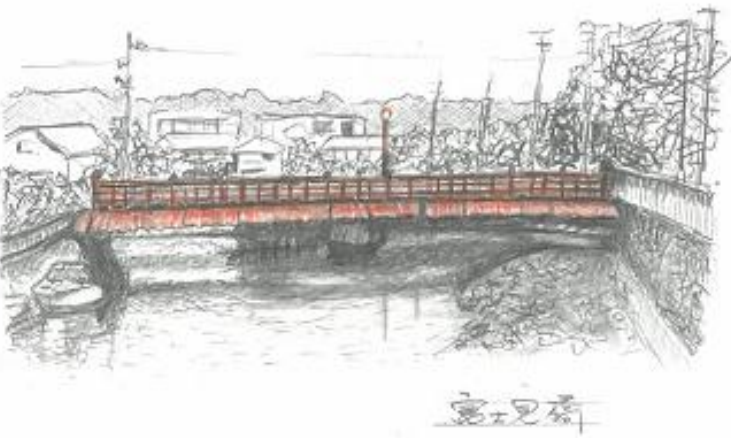
「富士見橋」 絵 土谷 正巳