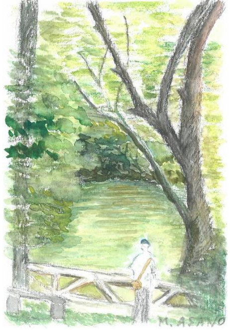
「久木大池」深山幽谷の趣あり 6.22

自然の中で研ぎ澄まされた人間の五感に季節の移ろいを逸早く知らせる樹木や草花が発する色や白いこそがそれであるが、自然は、そんな環境の中では何時も、その力やこころの広大さ・強烈さ・優しさで、私に何かを教えてくれる。