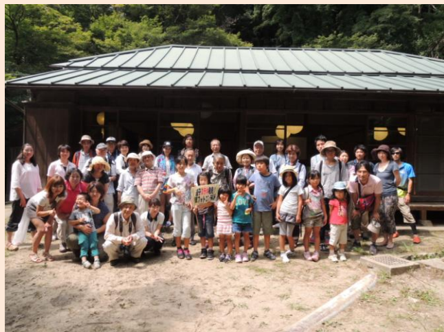
第一休憩所での集合写真☆