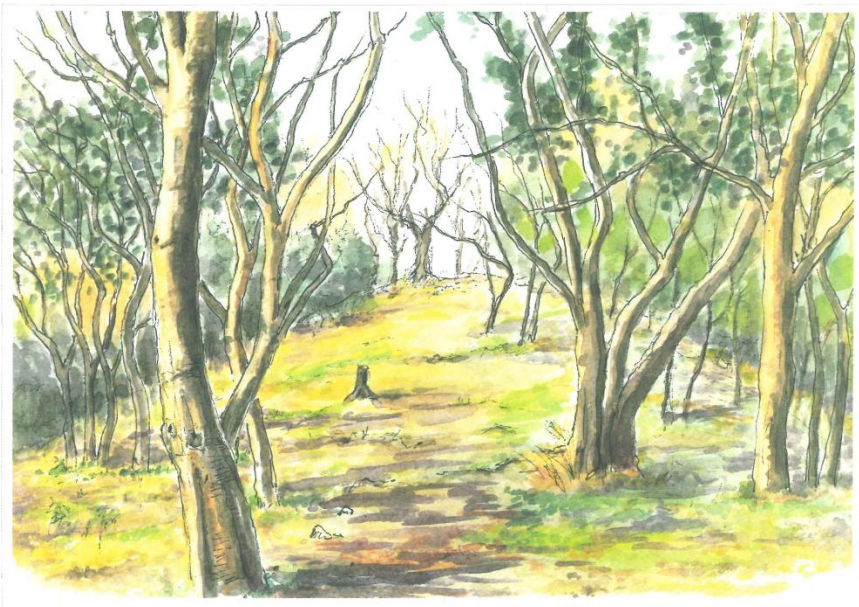
「県内最大級の前方後円墳を前にして」

2〜4階建てになっているものも多く前記の古墳群が「戸建て」ならこちらはさしずめ「マンション」である。被葬者は武士・僧侶であるそうで「武家の古都・鎌倉」の証の一つである。