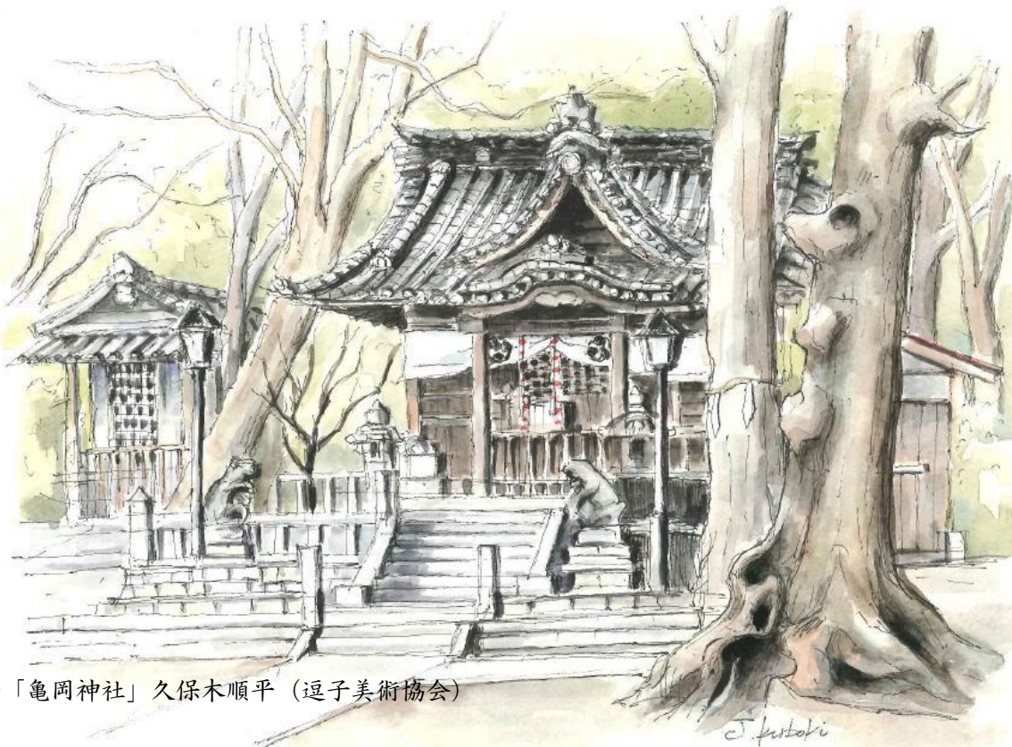
絵「亀岡神社」久保木順平（逗子美術協会）