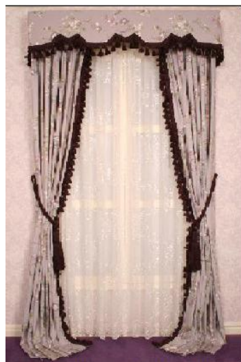
カーテンは、こんなに楽しい