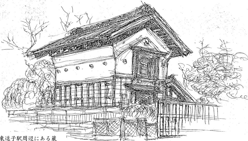
東逗子駅周辺にある蔵

いま逗子を歩いて気になるのは、マチの緑が少なくなっている事です。今在る樹木を残すだけでも景観、環境上大いに有効ですが、家の周囲の僅かな隙間でも樹木を植えれば、マチの表情は和らぎ、美しく好ましい景観に近づくのです。これは誰にでも出来る景観まちづくりの早道であり王道だと言えましょう。