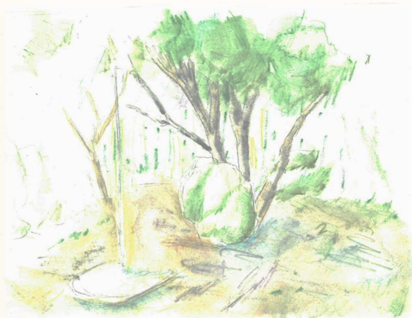
絵：披露山の楠の木 M.N (中二)

タブの木の花言葉は鎮魂です。これからもタブの 木に見守ってもらって活動を続けていけることを 改めて嬉しく感じる今年の春です。