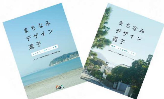
『みんなで見学を考える本』 『景観づくりを実践する本』 - 実践のヒント集 -

逗子市と市民団体『ほととぎす隊景観部会』が、市民への景観意識の普及を目的に共同作成した冊子です。逗子独自の自然と融合した、ゆったりとした空間や時間の流れを継承し、個々人でもまちなみデザインができるよう、身近にできる景観づくりのヒントがわかりやすくイラスト付きで書かれています。