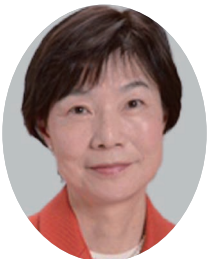
えぶち まきこ 江渕真紀子② (公明党)