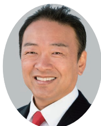
きくち しゅんいち 菊池 俊一⑦ (自由民主党)