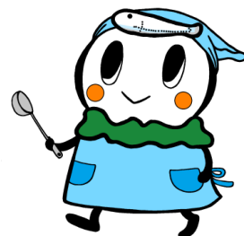
逗子市食育推進キャラクター しらわかちゃん