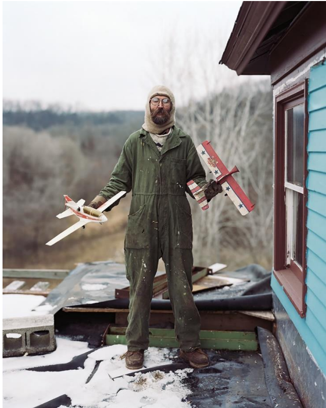
《チャールズ、ミネソタ州ヴァーサ》 〈Sleeping by the Mississippi〉より 2002年