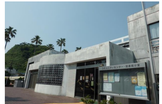
小坪小学校区コミュニティセンター