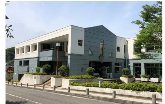
沼間小学校区コミュニティセンター