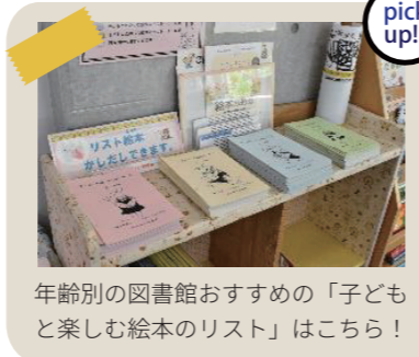
年齢別の図書館おすすめの「子どもと楽しむ絵本のリスト」はこちら!