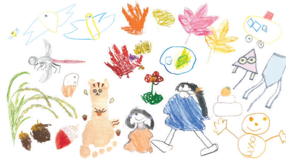
▲現役スタッフの子どもたちが描きました!