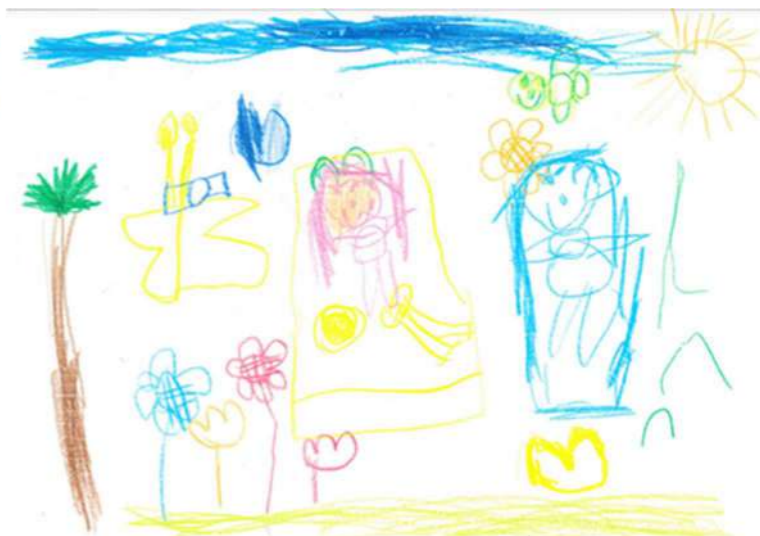
久木のRちゃん(5才)が描いてくれました