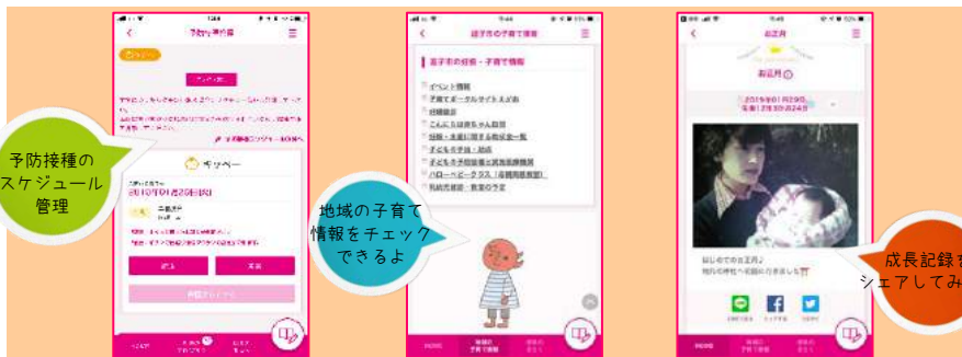
予防接種のスケジュール管理

このアプリは、電子ならではの便利な機能を使って冊子の母子健康手帳を補完するものです。健診や予防接種などを受診される際は、冊子の母子健康手帳が必要となりますのでご注意ください。