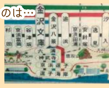
第一運動公園の赤い電車の中に、旧路線図があるよ!

京急新逗子駅 新逗子駅が長いのは… 1985年(昭和60年)「京浜逗子」と「逗子海岸」という二つの駅を統合、「京急新逗子駅」が誕生。北口からホームにたどり着くまで「遠いな～」と思っていたけど、そういう事なら納得! 2020年3月に駅名変更と発表されたね!