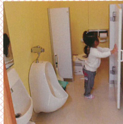
答えは裏面を見てね！

パッと見はふつうのトイレですが… なんと！これは幼児用のキッズトイレなのです！子どもが腰かけやすく、トイレトレーニングがはかどりそうですね♪さて、どこにあるかわかるかな〜？ どこか“ほっと”できる施設の中にあるよ！