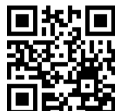
「離乳食(中期・後期)」 逗子市Youtube