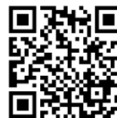
「はじめての離乳食」 逗子市Youtube