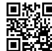
「離乳食(中期・後期)」 逗子市Youtube