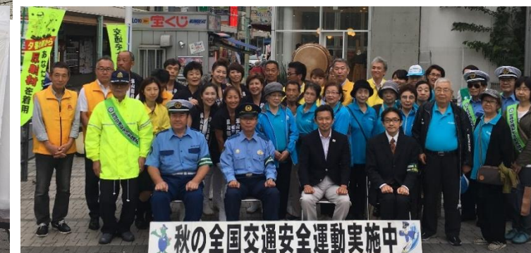
秋の全国交通安全運動キャンペーンも同時開催

アンケートは、250名以上もの回答をいただきました。ご協力、ありがとうございました。