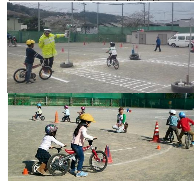
以前開催したトモイク自転車教室の様子

環境にやさしい自転車や徒歩でまちの魅力を探るポイントラリー「ツール・ド・逗子2018」も開催予定！！