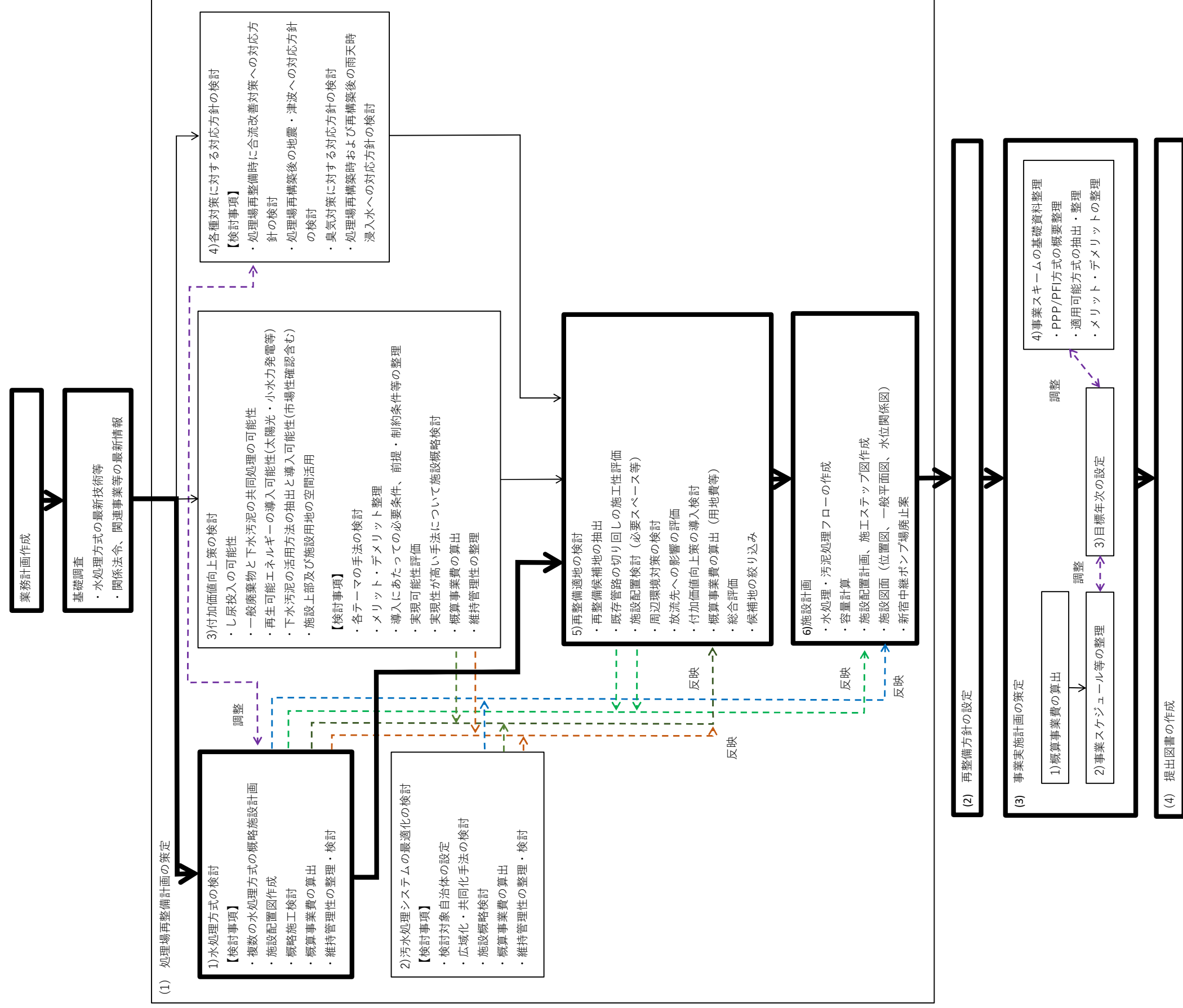
図 1-4-1 業務フロー