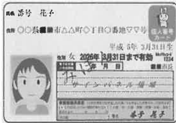
個人番号カード(表面)

◆マイナンバーカード（個人番号カード）をお持ちの方は、表裏両面の写しを貼りつけてください。*