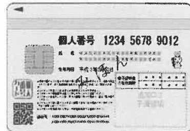
個人番号カード(裏面)

◆マイナンバーカードをお持ちでない方は、マイナンバーを確認できる書類（個人番号通知カード等）と身元確認書類（運転免許証、パスポート等）の写しを貼りつけてください。*