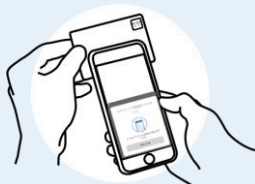
マイナンバーカード 読み取り