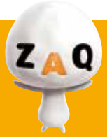
ケーブルインターネット ZAQのキャラクター「ざっくう」