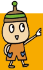
逗子市広報キャラクター「シズオ」