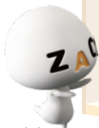
ケーブルインターネット ZAQのキャラクター「ざっくろ」