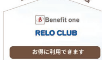
福利厚生サービス加盟店