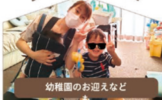
上の子のベビーシッター