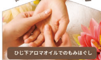
無料ハンドリラクゼーション