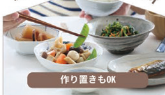
産後回復・母乳・ご家庭の味付け