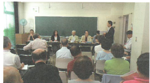
平成29年度通常総会