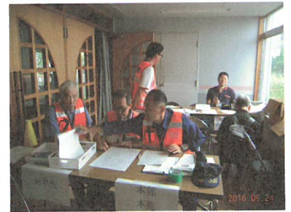
運営本部と情報広報班（後方）

9月24日（土）9時30分から、沼間小学校地区では第10回避難所運営訓練を大災害時の拠点である沼間中学校で ○実際の避難所のイメージを持っておく ○実際に避難所を立ち上げなければならない時に、ご参加の皆さんにも避難所立ち上げのお手伝いをさせていただく この2つの目的で行いました。