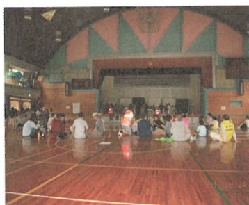
体育館に避難した住民

等の訓練プログラム・会場の配置・体験場所と時間などを記載した案内マップを作成し、参加者に配布して訓練の円滑な進行を図りました。