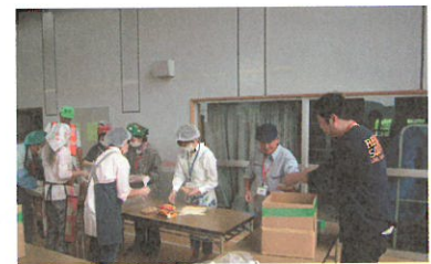
アルファ米調理中の食糧班

等の訓練プログラム・会場の配置・体験場所と時間などを記載した案内マップを作成し、参加者に配布して訓練の円滑な進行を図りました。