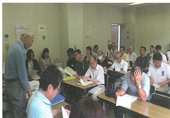
臨時総会での審議の様子