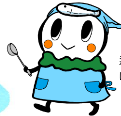
逗子市食育推進キャラクター しらわちゃん